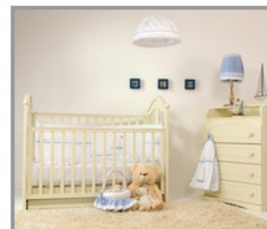
Κούνια, ντουλάπα και ... ;

... αλη στιγμή. Πρέπει να βρούμε στα μαγαζιά και να αγοράσουμε τα βασικά για το δωμάτιο του νέου μέλους της οικογένειας. Ξέχωρα από το στυλ διακόσμησης που θα επιλέξουμε υπάρχουν κάποια βασικά έπιπλα και αντικείμενα που κάθε νέο ζευγάρι θα πρέπει να προμηθευτεί προκειμένου να εξασφαλίσει τις ιδιαίτερες ανάγκες του μωρού. Ας ξεκινήσουμε με τη βασική λίστα.